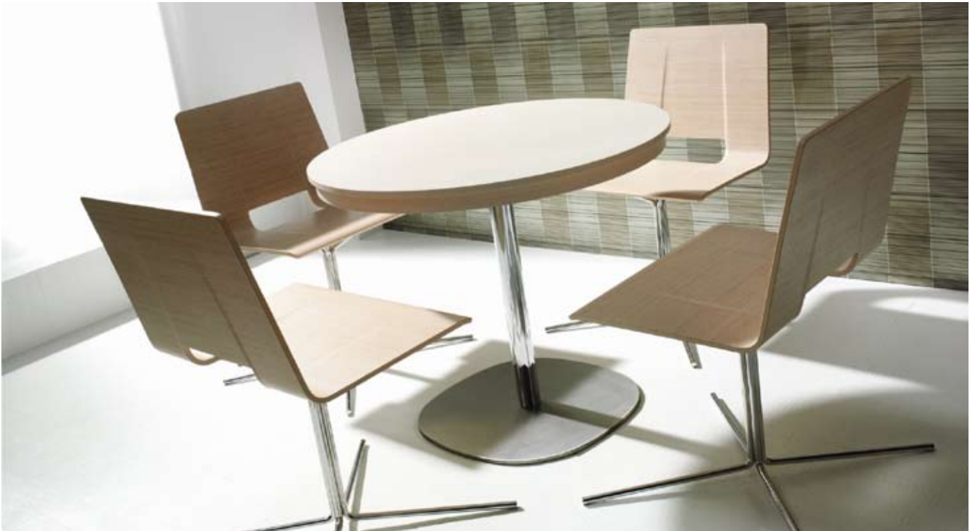
Gosth - Zess