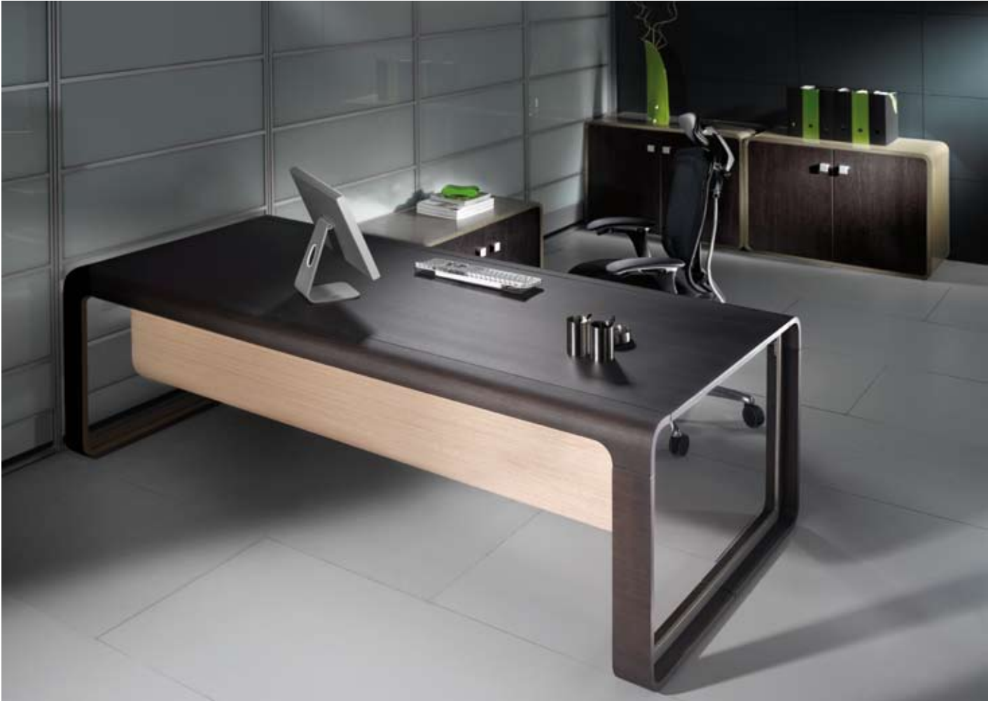
S2 - Bior

Si se diseña con la fórmula anterior, seguro que esa colección funciona en cualquier espacio, pero por lo general son los propios fabricantes los que te encaminan hacia una dirección concreta y eso recorta la libertad de creación.