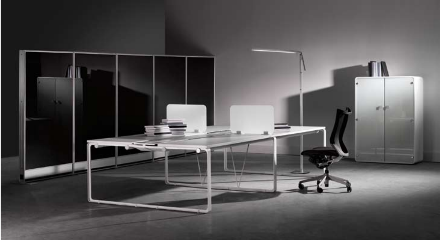
S2 - Bior

Según sus propias palabras, la silla mimosa nació mientras jugaba con un papel. Me da miedo darle según que cosa para que se entretenga... ¿El diseño nace de algo tan “superficial”? ¿El diseño es algo inesperado?