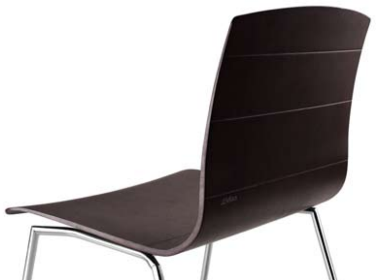
Itaida - Ofita