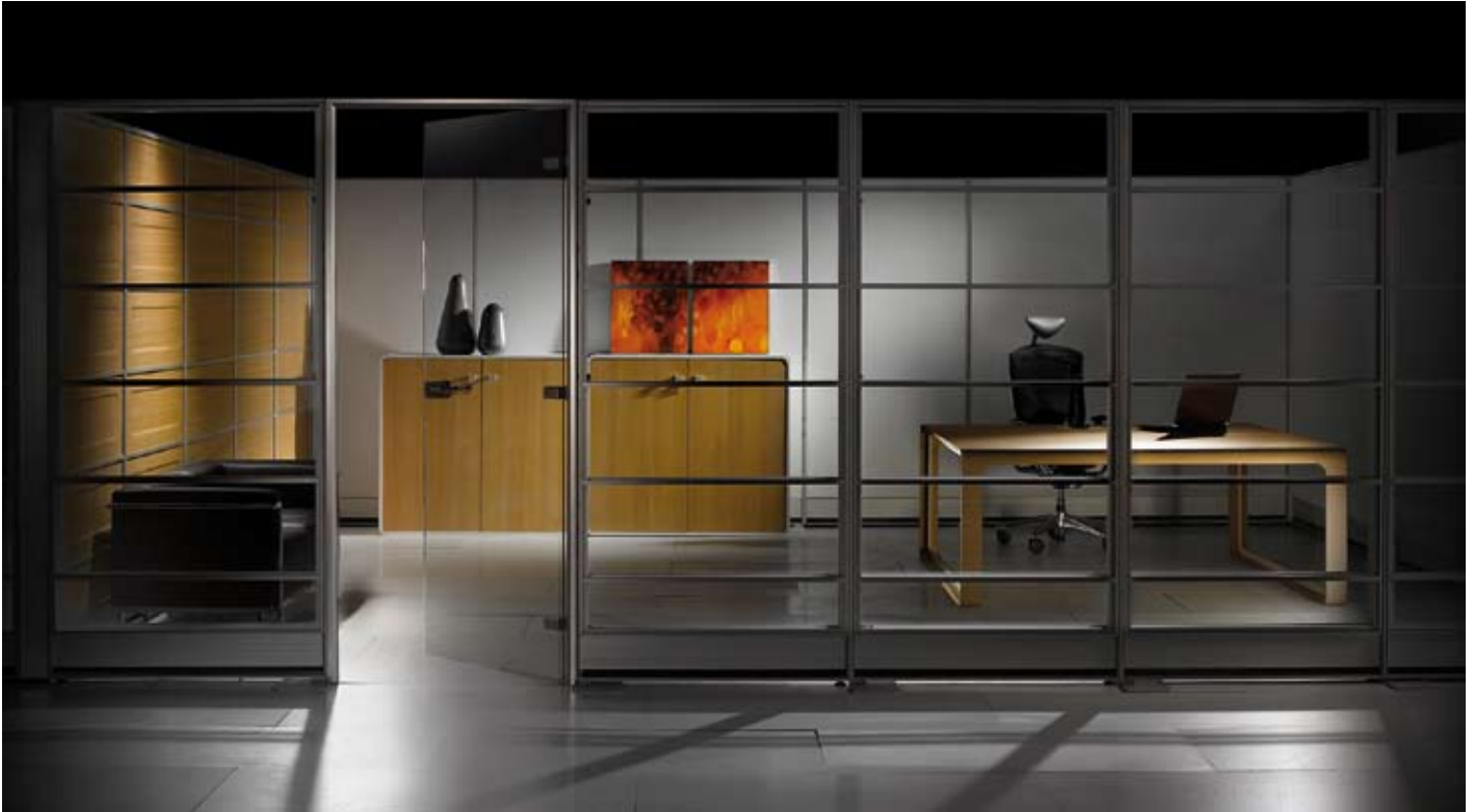
S2 - Bior