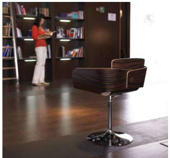
Mimosa - Ofita

no en el grado que me gustaría, pero por lo menos intentarlo. Por ejemplo la silla Gosth de Zess es un proyecto en el que sólo se emplea madera certificada, acero y pintura de epoxy, no tóxica. Son elementos totalmente reciclables. Hay fabricantes que lo entienden y se involucran y otros no tanto, pero cada vez la conciencia en este tema es mayor. Debemos aprender del diseño nórdico, que en estos temas nos llevan mucha ventaja.