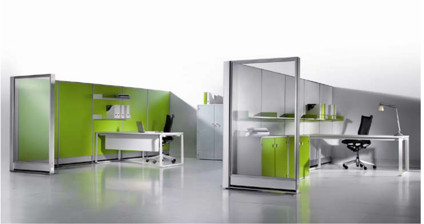
S2 - Bior

De todas formas yo creo que es un poco el estilo de vida de cada persona. Concretamente, yo vivo en un pequeño pueblo medieval, muy cerca de Vitoria, rodeado de montes y de un maravilloso lago. Soy muy afortunado de poder convivir con el mundo loco de las tecnologías y con una vida entre bosques infinitos, calles medievales y tranquilidad.