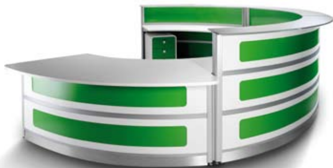
R-Plus - Bior

Nuestro diseño tiene muy pocos objetivos, pero necesarios e importantísimos. El proyecto perfecto es el que perdura en el tiempo y se sigue vendiendo. Si se consigue hacer un “clásico” lo has conseguido. Has mezclado con éxito, diseño, función, coherencia, honestidad contigo mismo y con el fabricante. Si haces todo esto, consigues diseños redondos, equilibrados, que emocionan.