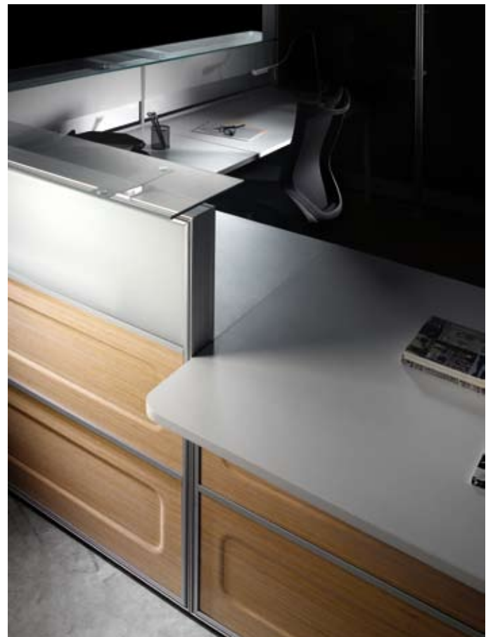
S2 - Bior

1 - Los que se diseñan para cumplir el mayor número de necesidades y funciones posible, sin perder de vista su diseño, como puede ser el caso de S2 de Bior. Esta colección tardó en ver la luz 2 años y medio. Fue un duro trabajo de análisis, diseño, creación y una gran carga de ingeniería, tanto para nosotros como para Bior. Basta con decir que mi mesa, en la yo trabajo es una mesa S2 de madera. Quedé encantado con esta colección.